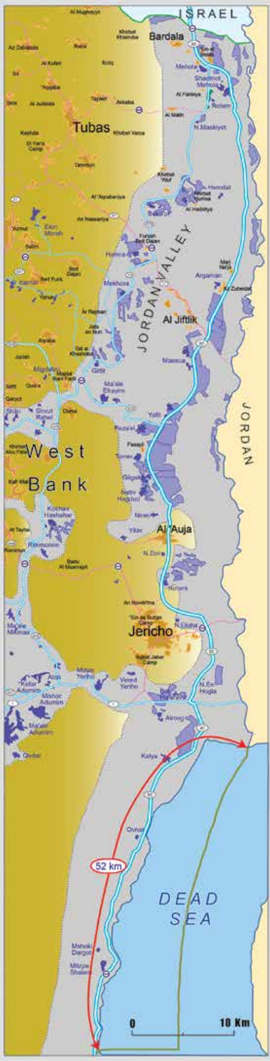
Exploitation of Palestinian Resources Water Extraction in the Jordan Valley